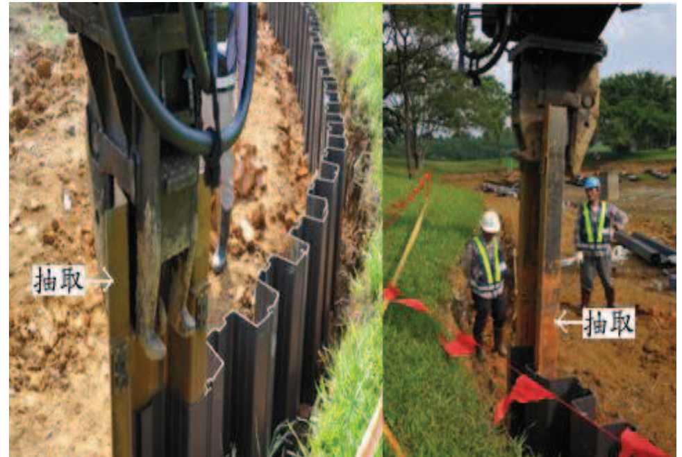
步驟十：抽取鋼板導樁