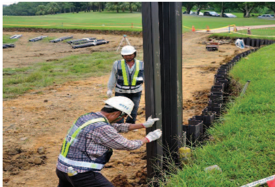
步驟六：板樁對準前樁套合後滑入前樁至地面土層