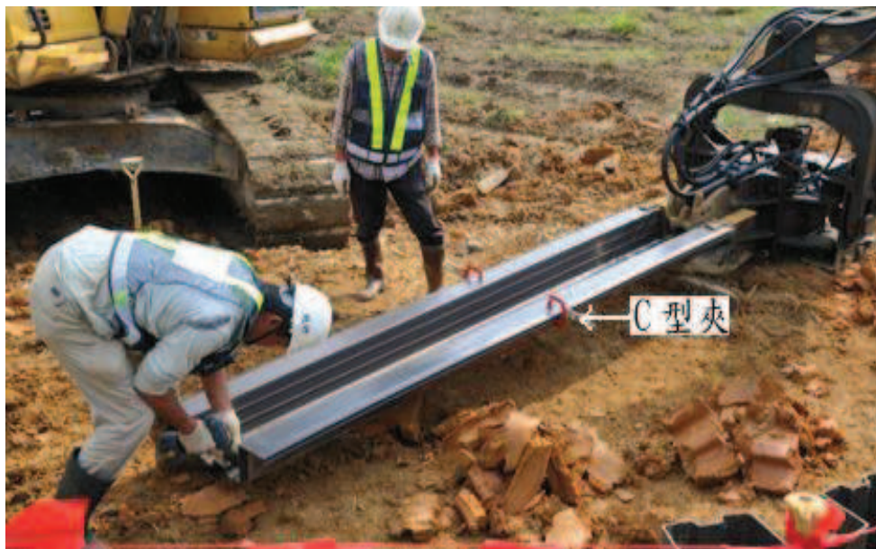
步驟三：中段以C型夾固定