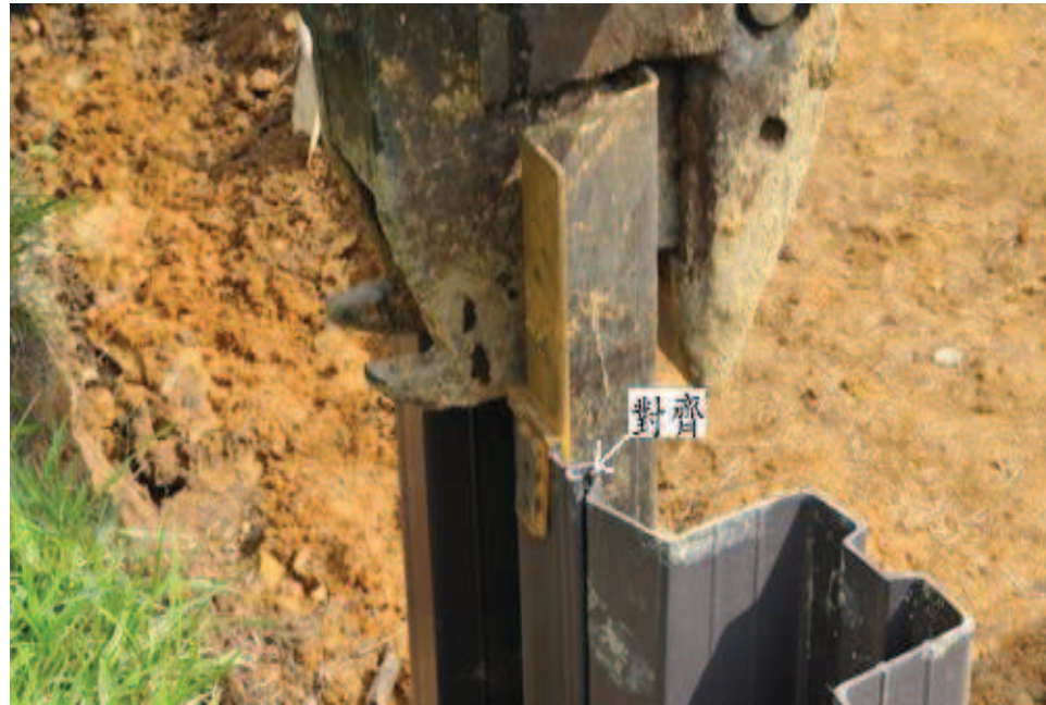
步驟九：板樁打入與前樁對齊