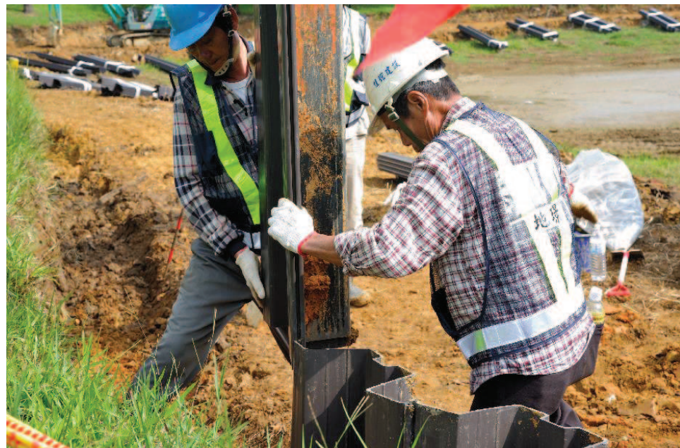
步驟五：板樁吊起並對準前樁套合