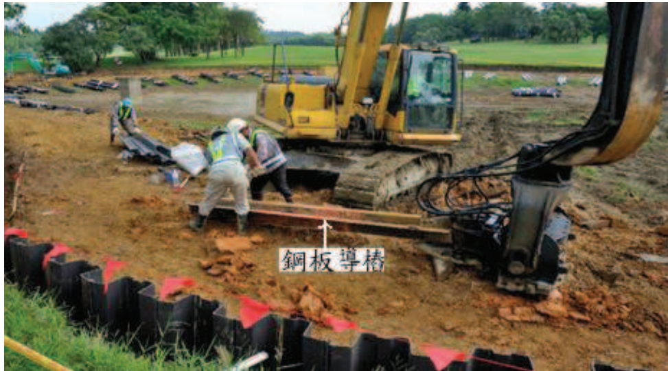
步驟一：鋼板導樁安置